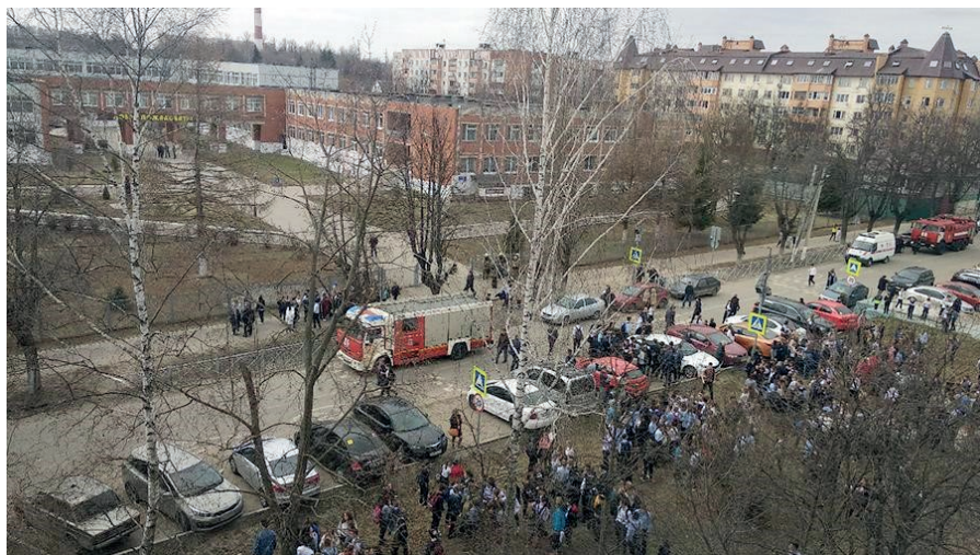
На фото: эвакуация школы в городе Бронницы после сообщения о минировании.

В декабре 2019 года число звонков и сообщений по электронной почте о якобы заложенных бомбах в Москве приняло столь массовый характер, что число эвакуированных полицией граждан из объектов по всему городу несколько раз обновляло рекорды. Так, 10 декабря в очередной пик «минирования» были эвакуированы 120 тыс. человек с территорий 400 объектов, в том числе из здания Верховного суда РФ и еще нескольких райсудов, аэропорта Шереметьево, 26 станций столичного метро и академии ФСБ. 19 декабря установлен новый рекорд — 170 тыс. эвакуированных горожан. Угрозы о заложенных бомбах в этот день получили примерно на 1 тыс. объектов, в том числе в 20 медицинских организациях, 12 районных судах, сразу нескольких аэропортах и 250 станциях метро). 20 декабря сотрудники оперативных служб проверяли сразу все станции столичного метро на предмет угрозы взрыва после звонков о заложенных бомбах. В Санкт-Петербурге в этот день были эвакуированы посетители семи районных судов; ранее спецслужбы проверяли на угрозу взрыва Эрмитаж, больницы и станции метро.