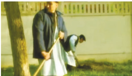
Переодетые в белые халаты и ватники участники преступной группы.

переодетые в белые халаты и ватники участники преступной группы, готовясь к нападению, расчищали снег на запасной дороге, ведущей к запасным воротам больницы, и проложили провод длиной 250 м к взрывному устройству, дистанционно приведённому в действие из угнанной накануне автомашины. Взрыв привёл в негодность линию телефонной связи в колодце на территории больницы в момент совершения нападения. Преступление осталось нераскрытым.