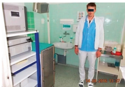
Вор, задержанный на месте, в больнице чешского города Мост.

Вор среди бела дня попытался ограбить больницу в чешском городе Мост. Злоумышленник надел халат и белые брюки с расчетом, что такая маскировка позволит ему раствориться среди остальных работников медучреждения.